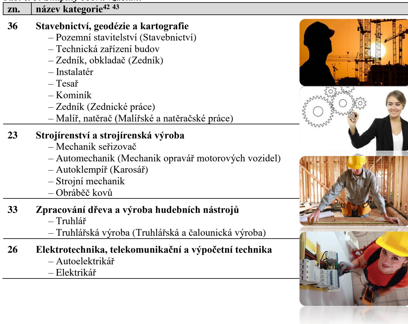
Tab. č. 3: Skupiny oborů vzdělání